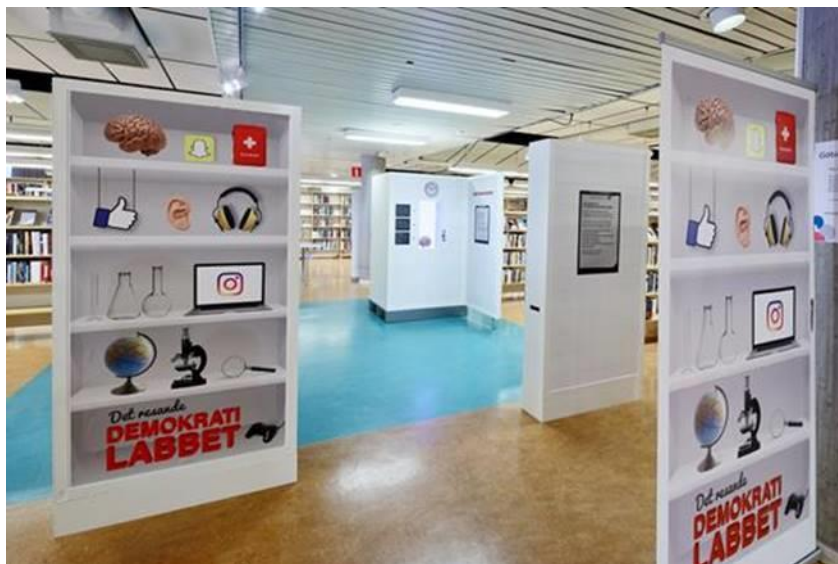
Bild från utställningen Det resande demokratilabbet på Arbetets museum.