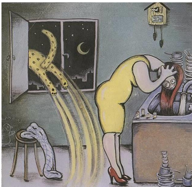
Ur Jagaren av Ulf Stark och Anna Höglund