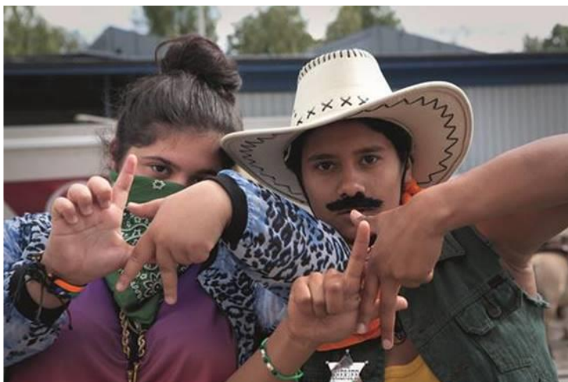
Ur filmen Amatörer av Gabriella Pichler.

Hela programmet i Norrköping finns i bifogad konferensinbjudan.