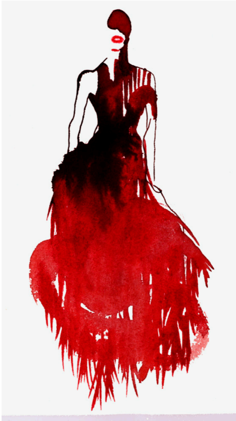
Illustration av Stina Wirsén, Alexander McQueen, Savage Beauty.