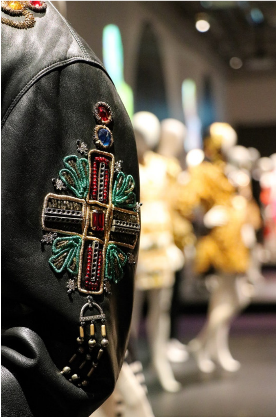
Bild från Textilmuseets utställning vintern 2019-våren 2020 Gianni Versace Retrospective.